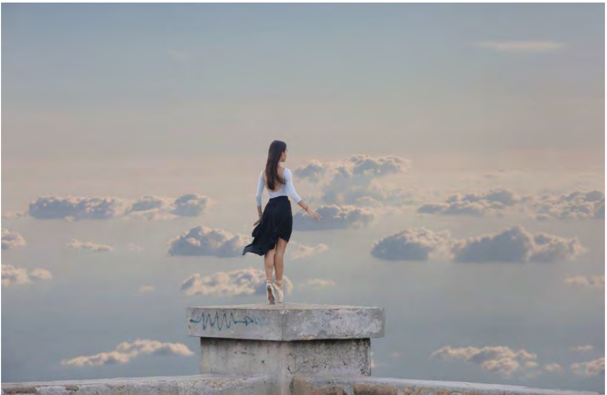
Gabriel Guerra Bianchini – vincitore di UP2018, The Glass Island , 2018.